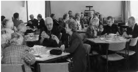
De contactdag van emeriti en predikantsweduwen.