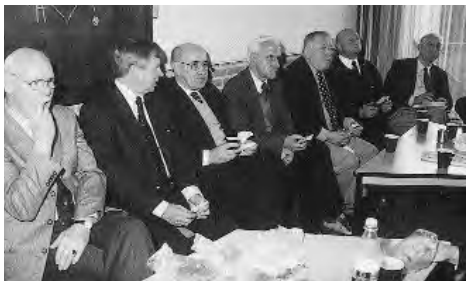
Middagpauze tijdens de najaarsconferentie.