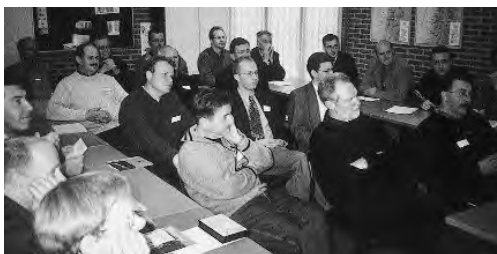
De 'Dag voor de Diaken' op 30 november.

Stress en ICT, Diaken: hulpouderling?, Gerichte giften, Werelddiaconaat, en het Persoons Gebonden Budget. Ook verzendt het deputaatschap twee preeksets: ten behoeve van biddag verschijnt een preekset, gemaakt door ds. W.N.