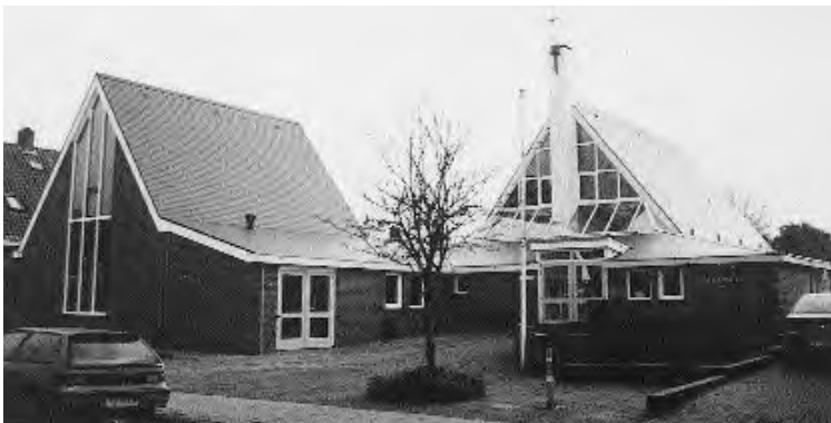
Het uitgebreide kerkgebouw van Emmen.

kunnen begeleiden neemt de Pniëlkerk in Urk een zogenaamd Leeflang-orgel in gebruik, afkomstig uit de Gereformeerde Petrakerk in Den Haag. Ook de Barnabaskerk te Apeldoorn krijgt een ander orgel. Daar zijn in het vervolg de tonen van het orgel van de Nederlandse Hervormde Pauluskerk uit Den Haag te horen.