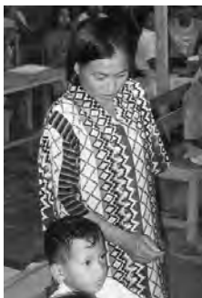
In samenwerking met deputaten Hulpverlening konden scholen gebouwd worden in Bunggu.