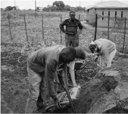
Dienstverlening jongeren wereldwijd helpt mee met de bouw van een kerk.