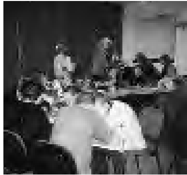
LCJ, de actiestartavond voor de -16 jongeren

Veel werk wordt door de jeugdwerkadviseurs verzet voor de meer dan dertig regionale jeugdcontactbijeenkomsten en in verband met kadervorming naar aanleiding van de thema's 'De leef- en denkwereld van jongeren' en 'Een (geestelijk) gesprek met jongeren'. Bovendien worden twee Bijbelstudieconferenties voor jongeren georganiseerd.