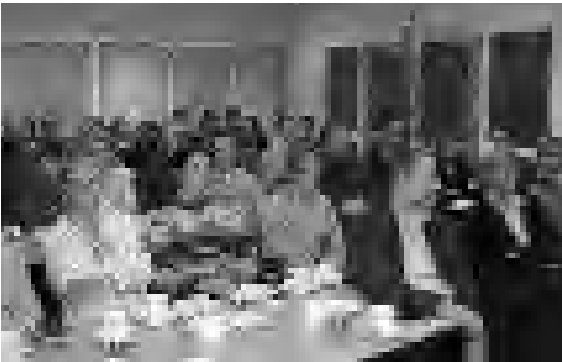
'Kavo avond' LCJ. De kadervormingsavonden zijn goed bezocht.