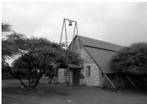
Kerk in D'kar