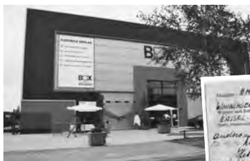
Het gebouw van Box Inn