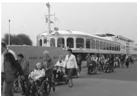
Even van boord

Drie vakanties voor gehandicapten werden georganiseerd: een bootreis met de Prins Willem Alexander, de Rooseveltweek en een Jongerenreis naar Loon op Zand.