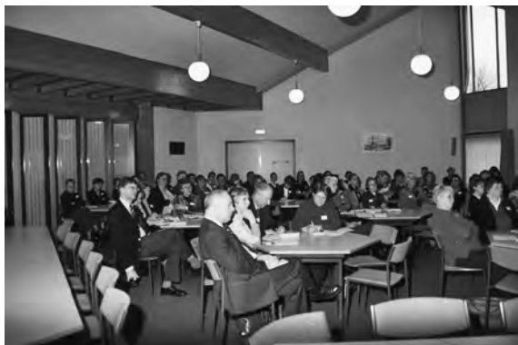
De themadag in Bunschoten