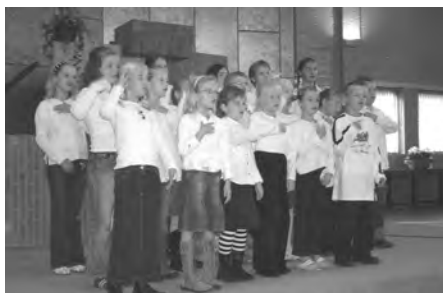
Het gastkoor 'Immanuël'

Tijdens de jaarvergadering werd door de zondagsscholen unaniem toestemming verleend tot een integratie van de bond in het Landelijk Contact Jeugdverenigingen. Daar waren jaren van besprekingen tussen de bond en het LCJ aan vooraf gegaan. In die besprekingen werd het steeds duidelijker, dat het zou moeten komen tot een integratie van de bond om zo de zondagsscholen optimaal van dienst te kunnen zijn.