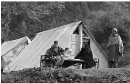
Noodhulp in Pakistan; eerst overleg met de betrokkenen