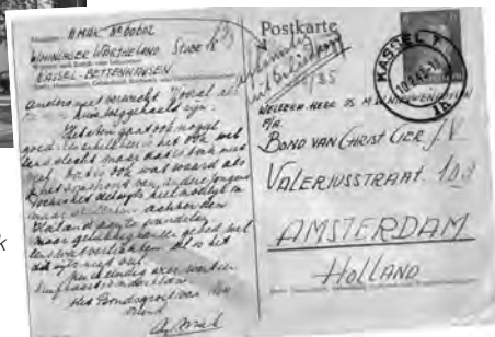
De kaart van A. Mak