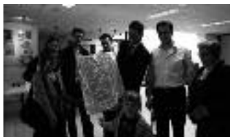
Impressie van de activiteiten