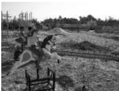
Speeltoestellen voor De Woestijnroos