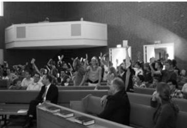
Kinderappel - 12

'Gods Koninkrijk... is gekomen en komt!'