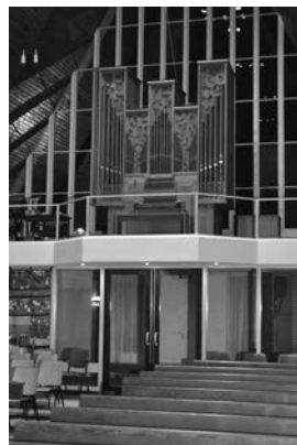
Het Leefflang-orgel van Doetinchem