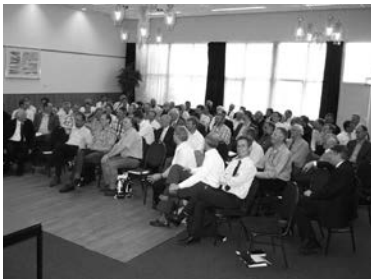
Nu eens zelf luisteraars