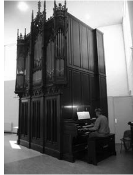
Het Fleiter-orgel van Leiden

Het kerkgebouw van Rotterdam-West wordt verkocht aan evangelische gemeente De Brandaris. De voormalige kerkenraad laat een fotoboek het licht zien.