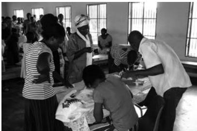
De gemeenteleden van Libangeni zamelen tijdens de kerkdienst geld in voor o.a. een nieuwe pastorie