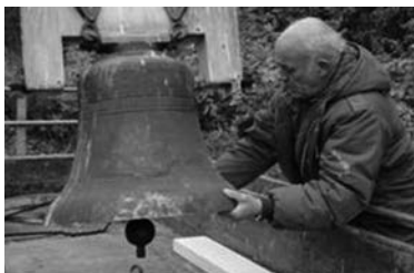
De klok van Harlingen

aan een accountantsbureau. Op 26 oktober wordt de klok van de Ichthuskerk verhuisd naar De Haven, het gebouw van de Gereformeerde Kerk (vrijg.), waar de beide gemeenten samenkomen.