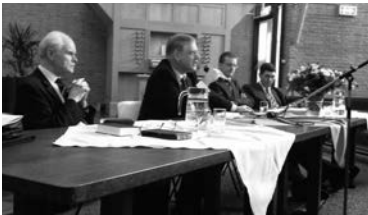
Tijdens de bespreking

Tijdens deze dagen ontvangen de bezoekers vanuit diverse thema's Bijbels, geestelijk en praktisch onderwijs. Hervormde (Geref.) en Chr. Geref. predikanten zijn bereid als sprekers gezamenlijk aan deze dagen inhoud te geven.