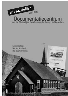
De omslag van de magazijnlijst