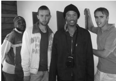
Het bouwteam in Botswana

Twee jongemannen hebben een bezoek gebracht aan Botswana. In D'kar hebben ze samen met twee San mensen gewerkt aan het opknappen van een hostel. In dit hostel worden mensen ondergebracht die naar D'kar komen voor het volgen van een cursus. Dit kan een verblijf van één nacht, maar ook wel van een jaar zijn. Ze hebben er een aantal kasten gerepareerd en