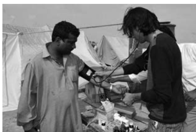
Onderzoek in Pakistan

gebieden in de wereld waar acute nood heerst – om wat voor redenen dan ook: door natuurgeweld of door menselijk toedoen. Ook in het afgelopen jaar hebben deputaten de kerken enkele keren dringend verzocht te collecteren voor dergelijke noodtoestanden: voor Haïti (aardbeving en cholera), voor Pakistan en India (overstromingen), voor Mozambique (grote droogte), voor Benin (overstromingen) en voor Indonesië (vulkaanuitbarsting). Telkens weer blijkt dat er ruimhartig gegeven wordt voor de acute nood in de wereld.