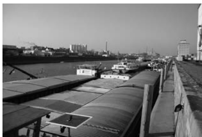
Schepen in Mannheim

Het koopvaardij-pastoraat aan de Moerdijk functioneert goed. Dat is niet in de laatste plaats te danken aan de vrijwilligers die hun tijd in dit project steken.