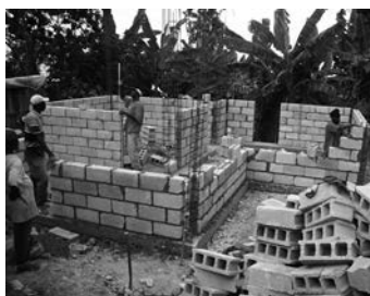
Herbouw in Haïti