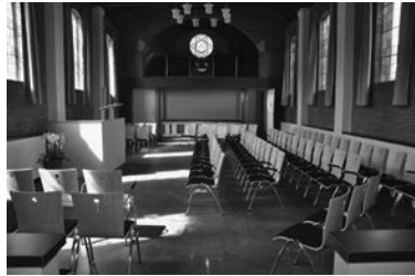
Het nieuwe interieur van Alblasserdam