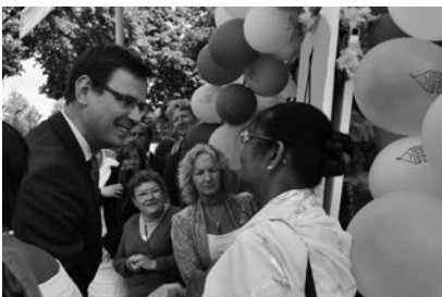
De opening van House of Hope