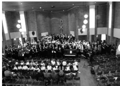
Uitvoering van 'Schiilplaats'

Op 17 april komen 800 jongeren van -16 bijeen in Schiphol-Rijk rondom het thema