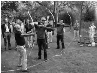
De boogschutters (à la Spreuken 26, 10a ?)