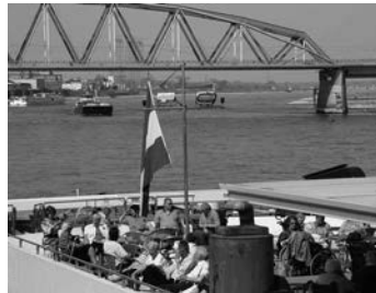
Op de boot