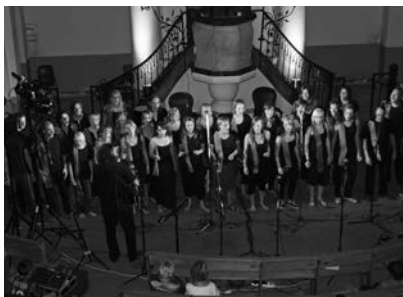
Het eerste concert

De tweede reis naar Frankrijk werd georganiseerd in samenwerking met de HGJB. Tijdens de zomervakantie heeft een groep van veertien jongelui uit ons land zich met een aantal Franse jongelui voorbereid op het geven van een aantal evangelisatieconcerten. Daartoe zijn met name negro-spirituals ingestudeerd. Het eerste concert werd in een klein kerkje gehouden, maar de volgende dag werd er in de grote kerk in Anduze een concert voor ongeveer 500 mensen gehouden. Daarna is er nog een concert voor ongeveer 300 mensen in Nîmes geweest. Door elke dag een Bijbelstudie te houden in kleine groepjes van Nederlanders en Fransen is er een heel hechte band ontstaan tussen de beide groepen.