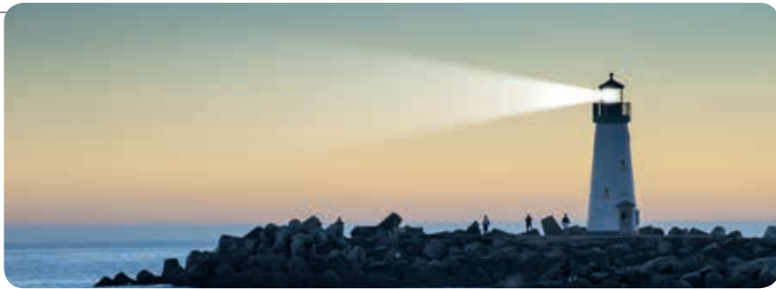
Zijn wij in ons 'geven en leven' een lichtend licht voor de wereld?

in deze wereld, de kerk en in de maatschappij. Zijn we dat ook in ons geef- en leefgedrag?