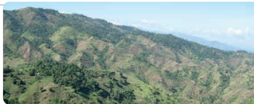
Ons leefgedrag blijft niet zonder gevolgen (ontbossing Haïti)

De in dit hoofdstuk afgedrukte Bijbelteksten zijn overgenomen uit de NBG-vertaling '51.