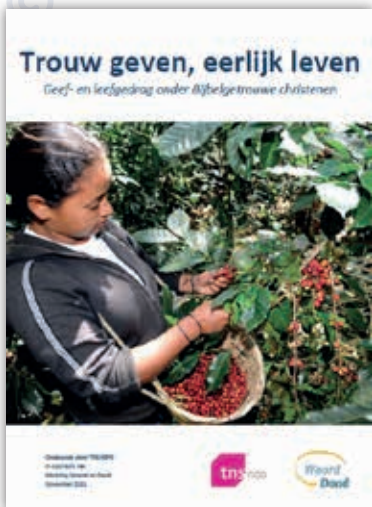
Onderzoeksrapport Trouw geven, eerlijk leven

Het rapport Trouw geven, eerlijk leven begint met het geefgedrag van de respondenten. Hoeveel geld doneren ze, aan wat voor type organisaties, en wat zijn hun motieven daarvoor? Het tweede hoofdstuk behandelt het leefgedrag. Hoe bewust leven Bijbelgetrouwe christenen en wat zijn hun motieven?