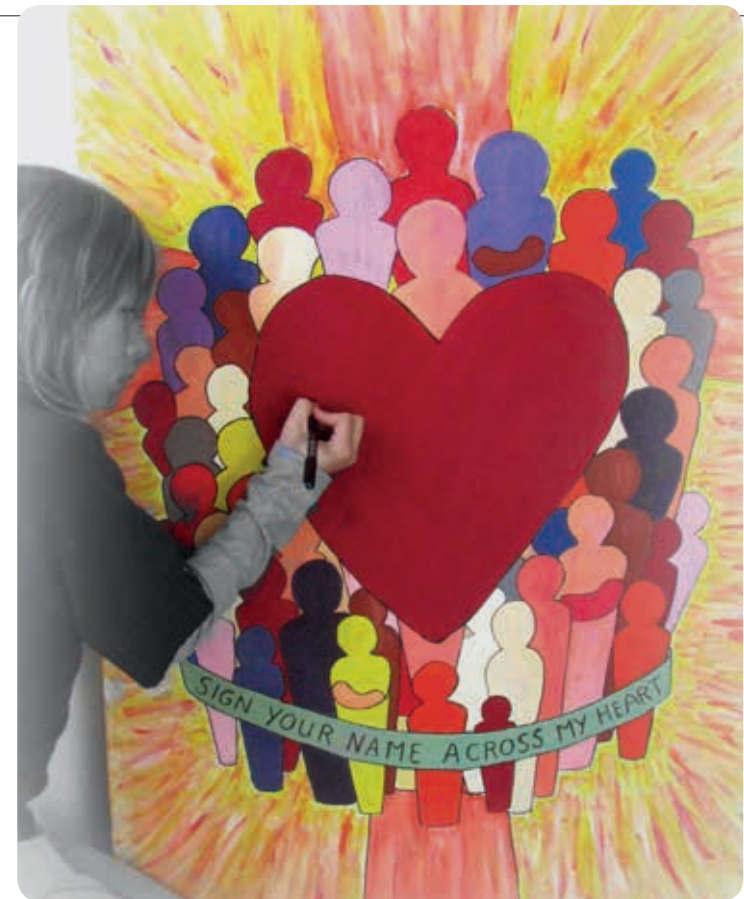
Elkaar liefhebben: de samenvatting van alle geboden

- in de eerste plaats in de gemeente als het lichaam van Christus (12: 3-8)! Elke gelovige heeft gaven gekregen om in de gemeente in te zetten: de gaven zijn heel verschillend, maar elke gave is nodig en belangrijk om het lichaam als één geheel te laten functioneren: profeteren, dienen, onderwijzen, bemoeiden, leiding geven, delen, barmhartigheid bewijzen;