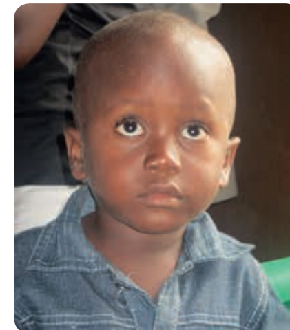
Recht doen aan de wees die onze hulp nodig heeft

“Zal de Here welgevallen hebben aan duizenden rammen, aan tienduizenden oliebeken? ‘...’ Hij heeft u bekendgemaakt, o mens, wat goed is en wat de Here van u vraagt: niet anders dan recht te doen en getrouwheid lief te hebben, en ootmoedig te wandelen met uw God.”