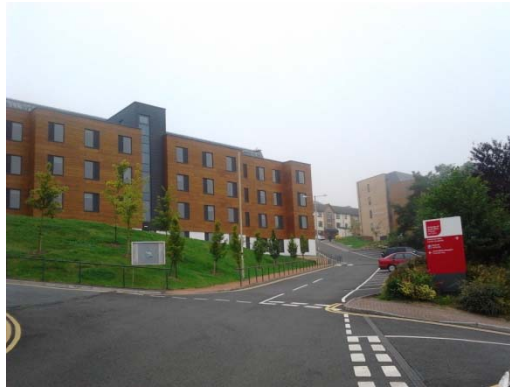
Conferentiecentrum en gastenverblijf op de campus van de South Wales University