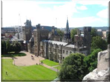
Kasteel van Cardiff

Zaterdag krijgen we gelegenheid om iets te zien van het prachtige Wales.