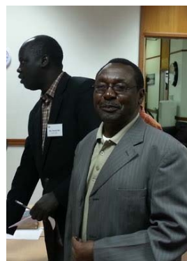
Soedan en Kenia