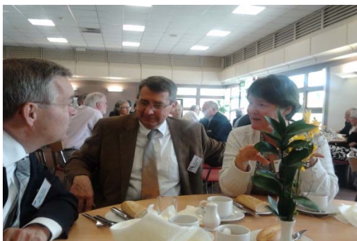
Orthodox Presbyterian Church of North America Br. Wisdom uit Duitsland