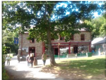
St Fagans openluchtmuseum Wales