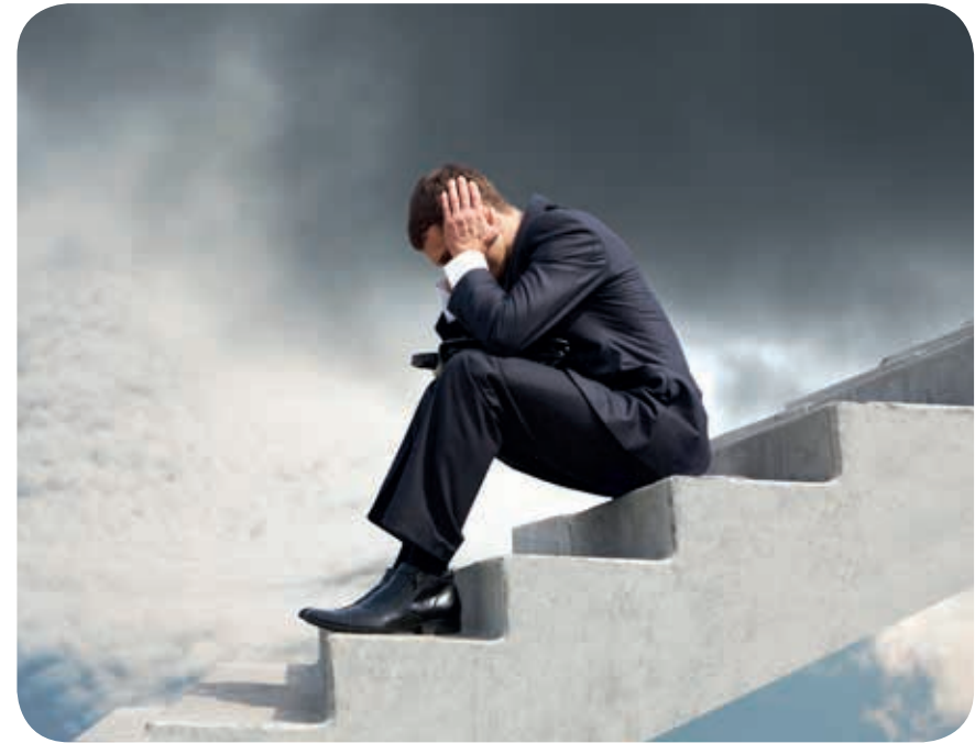
Lijden aan het werk

In de interviews komt ook naar voren dat werk belangrijk wordt gevonden, omdat je economisch zelfstandig moet kunnen zijn. De motivatie dat er brood op de plank moet komen, is dus nog steeds belangrijk. Anderzijds verschuift in de interviews toch ook de aandacht van de economische waarde van arbeid naar de betekenis van het werk zelf. Niemand noemt echter het aspect dat werken ook zwoegen kan zijn en dat er geleden kan worden aan het werk; zelfs niet degene die met een burn-out thuis kwam te zitten.