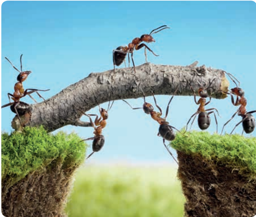
Investeren in samenwerking