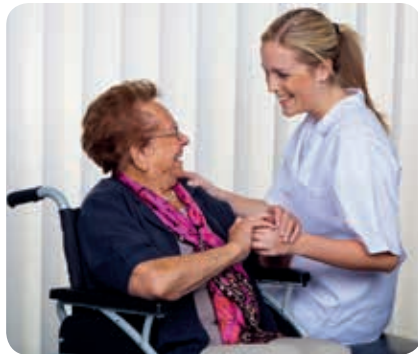
Veel mensen in de zorg ervaren hun werk als roeping