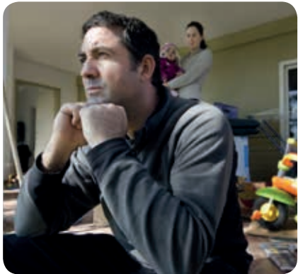
Zijn de gevolgen van werkloosheid bespreekbaar?