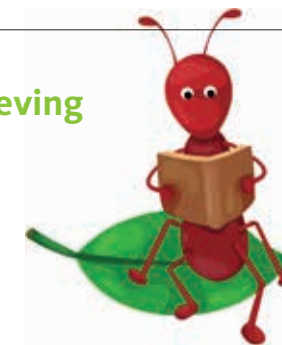
Werknemers moeten zichzelf ontplooiën

De omgeving waarin bedrijven opereren, is veranderd. Voorheen waren vooral strakke processen de kern van de bedrijfsvoering. Het werk werd gescheiden in werkvoorbereiding, werkuitvoering en controle. Dergelijke concepten voor het bedrijfsproces voldoen steeds minder. Door de economische situatie is er steeds meer noodzaak om op korte termijn kwalitatief hoogwaardige producten te leveren. Deze producten zijn steeds meer maatwerk op specificaties van de klant en ten behoeve van kleinere marktsegmenten. De grote maakindustrie verdwijnt naar landen waar arbeid minder kost en het werk in Nederland richt zich meer op innovatie en dienstverlening. Daardoor wordt er nu vooral creativiteit en flexi-