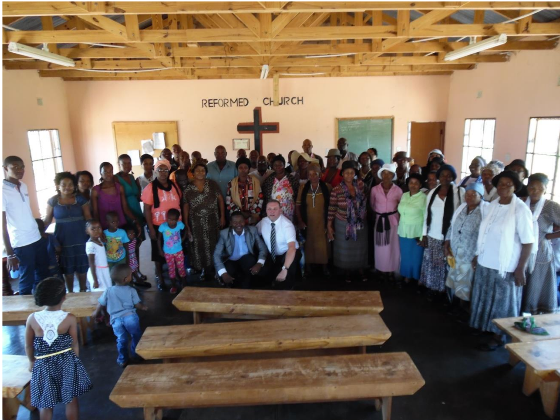
Gemeenteleden van Libangeni

Het is een hartelijke ontmoeting die wordt afgesloten met een maaltijd.