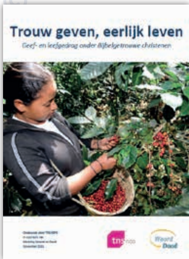
Onderzoeksrapport Trouw geven, eerlijk leven

Het rapport Trouw geven, eerlijk leven begint met het geefgedrag van de respondenten. Hoeveel geld doneren ze, aan wat voor type organisaties, en wat zijn hun motieven daarvoor? Het tweede hoofdstuk behandelt het leefgedrag. Hoe bewust leven Bijbelgetrouwe christenen en wat zijn hun motieven?